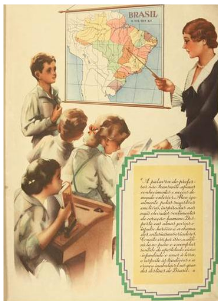
Figura 3 – Representação da sala de aula nas escolas regulares (Pintura)