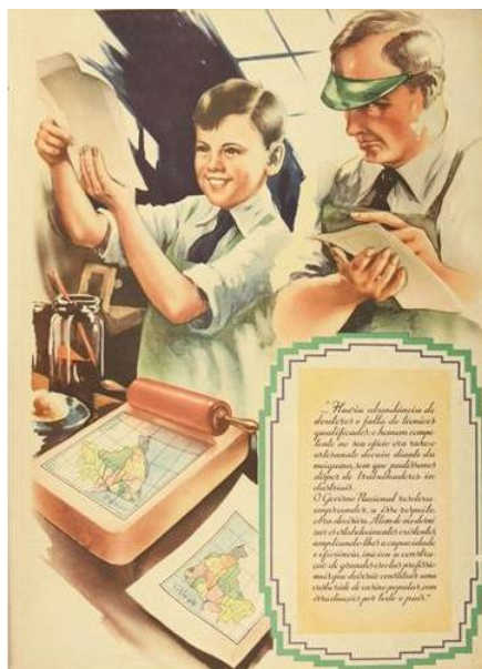
Figura 4 – Representação de uma aula em escola profissionalizante (Pintura).