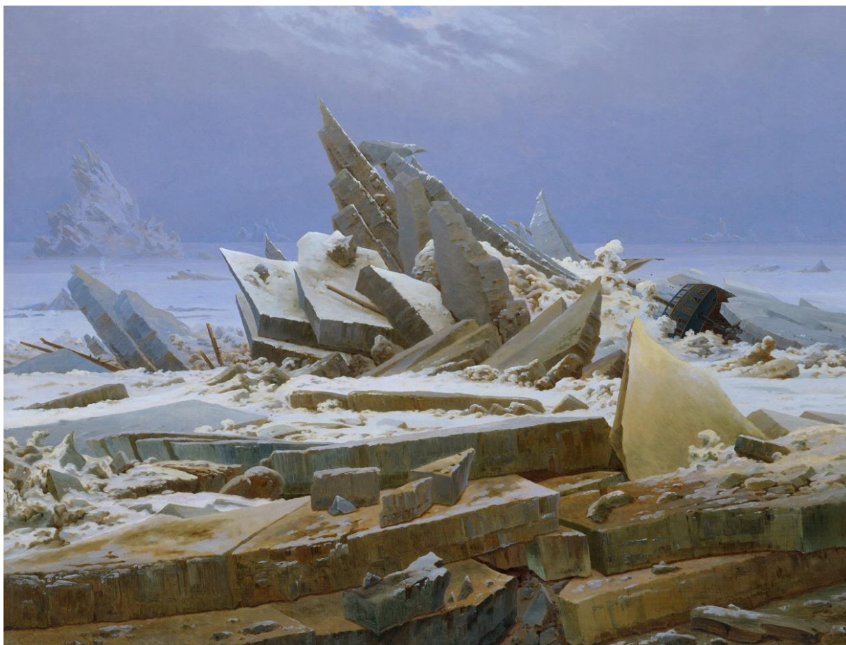
Figura 4 - O Mar de Gelo, de Caspar David Friedrich