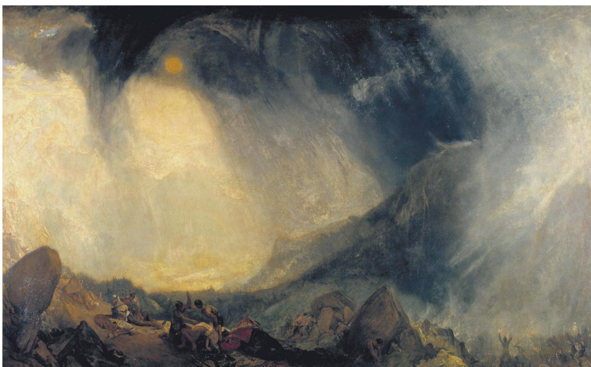
Figura 1 - Tempestade de Neve: Aníbal e seu Exército Atravessando os Alpes, de Joseph Mallord William Turner