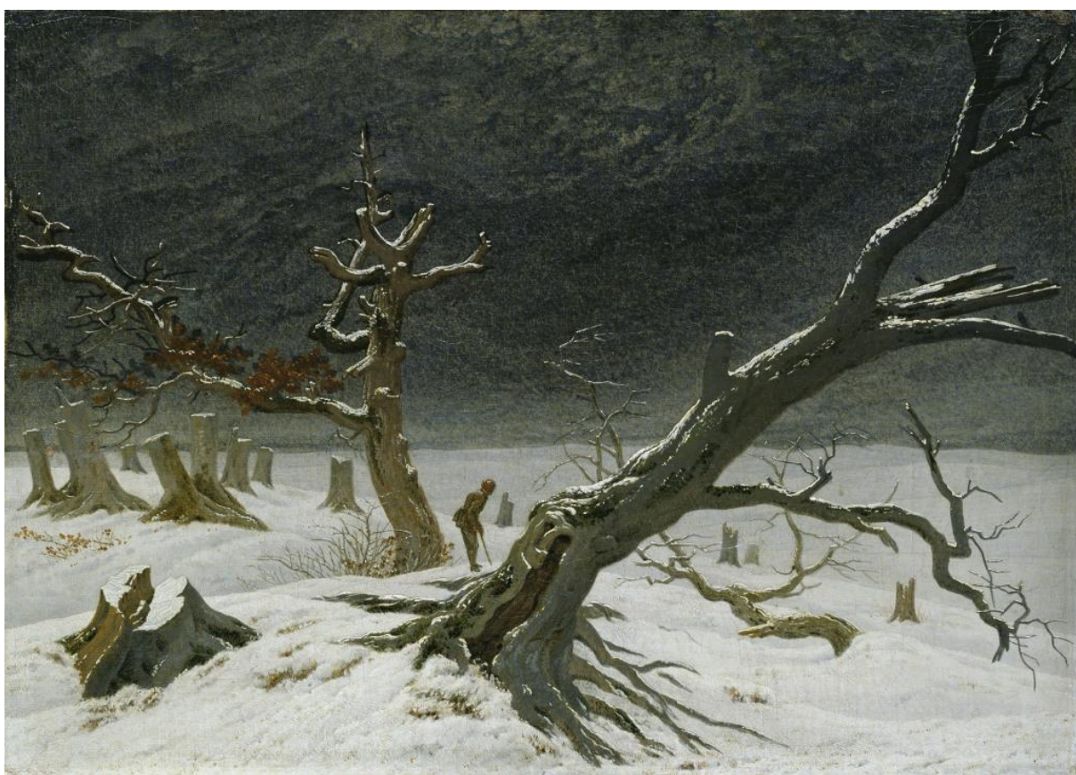
Figura 2 - Paisagem invernal, de Caspar David Friedrich

escritor conhecesse sua obra, no geral ignorada até o começo do século XX. 393 A associação não é de influência, mas de confluência temática. “O homem surge nestes quadros como ser solitário na natureza, cuja força o subjuga”, 394 coloca Ulrich Seeberg a respeito da obra do artista, e o mesmo poderia ser dito de paisagens como esta descritas em Tent Life in Siberia , inclusive com o próprio autor o fazendo, caracterizando a cena como “solitária”. Nestes momentos em que descreve cenários em que a natureza assume seu aspecto mais sinistro, o escritor utiliza-se de uma série de expressões que sugerem uma qualidade terrível, mas essencialmente indescritível: o céu cinzento é impiedoso, a brancura é pavorosa, as montanhas simplesmente “estranhas”. O mar, cujo movimento passa a ser misterioso, produz sons grotescos contra cavernas ocultas.