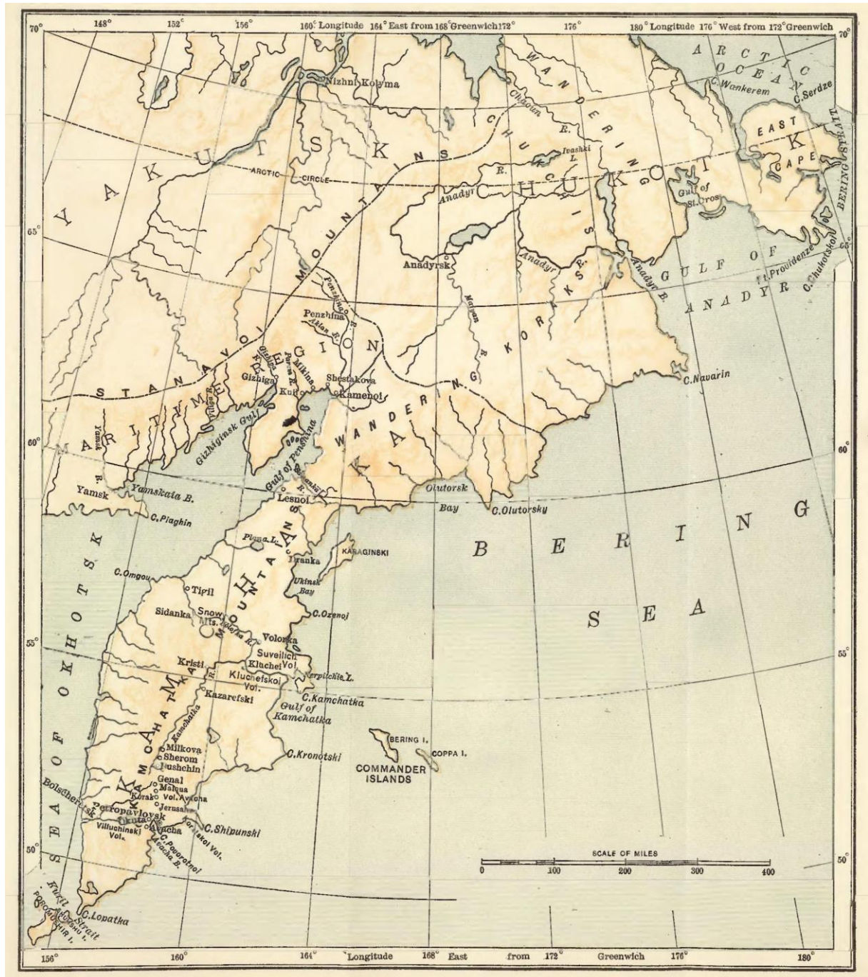
Mapa 1 - Área do leste siberiano percorrida por George Kennan entre 1865 e 1867