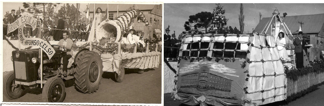
FIGURA 9: Desfile do Cinquentenário do Município de Bom Jesus. Carros Alegóricos das escolas Conde de Afonso Celso e Ginásio Nossa Senhora das Graças, respectivamente.