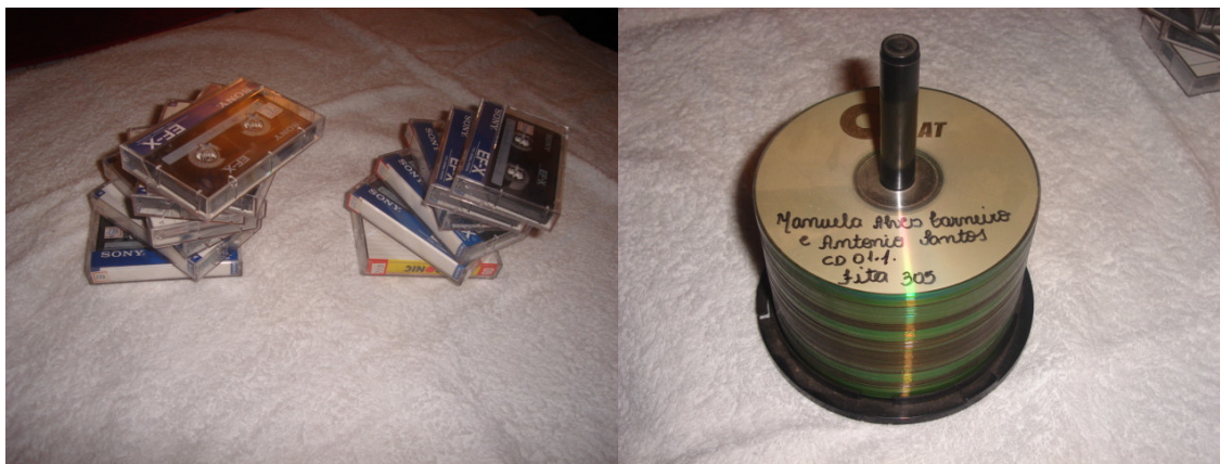
FIGURA 3: Acervo de Memória Oral, fitas-cassetes e CDs-(21/09/2006)

O subprojeto Vendo e Lembrando cujo objetivo foi coletar fotos, documentos e objetos relativos à história da cidade, limpá-los, catalogá-los e organizá-los para pesquisa, iniciou como todos, com uma idéia que foi para o papel.