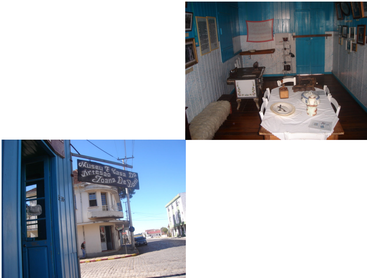
FIGURA 6: Museu e Casa do Artesão Joana De Boni 19