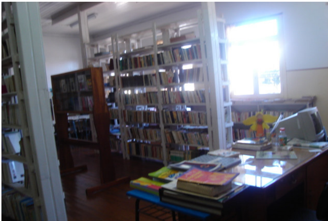
FIGURA 5: Biblioteca Pública Municipal de Bom Jesus-(21/09/2006).

Com o passar do tempo, e em função de a idéia do projeto ser “Leitura como fonte de desenvolvimento”, ocorreu em 1989 o início das feiras do livro no município, onde, no ano de 2004, ocorreu a XII edição da feira em âmbito municipal e “IV Feira Regional do Livro”.