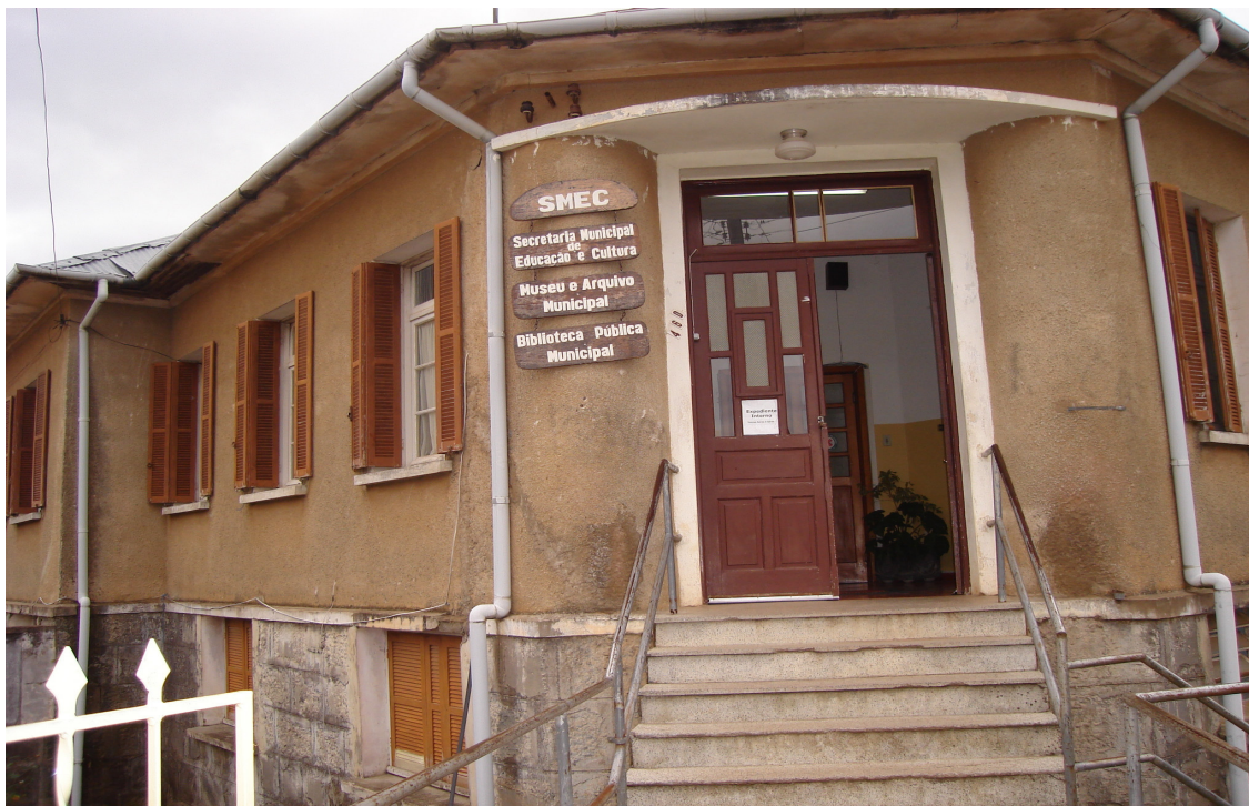
FIGURA 2: Secretaria Municipal de Educação e Cultura, Museu, Arquivo Municipal, Acervo de memória oral e Biblioteca Pública Municipal de Bom Jesus. (21/09/2007)

Ao descrever a trajetória do Projeto Resgatando Nossas Raízes, é fundamental discutir os pressupostos que o nortearam. Farei isso partindo do conceito de Pierre Nora sobre “lugares de memória”. Lugares que são definidos por ele como: “toda a unidade significativa, de ordem material ou ideal, da qual a vontade dos homens ou o trabalho do tempo fez um elemento simbólico do patrimônio da memória de uma comunidade qualquer” (1997, p. 16).