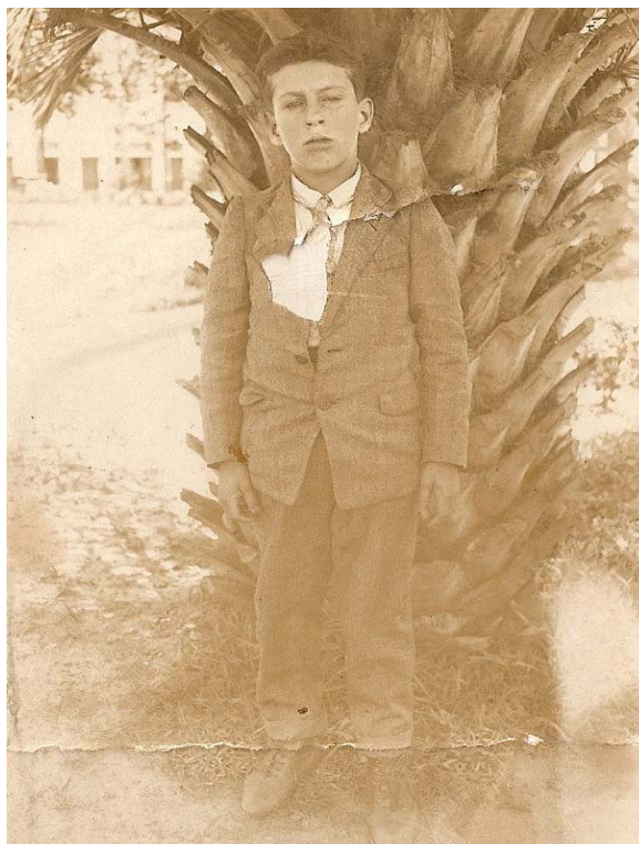
Figura 9: Para Matrícula no Instituto P. Machado – 1929.

com as transformações históricas da época, retratadas nessa obra. Era janeiro de 1929, quando Mozart transfere-se para Porto Alegre e matricula-se no Instituto Pinheiro Machado, da Escola de Engenharia de Porto Alegre, localizado no Morro Santana.