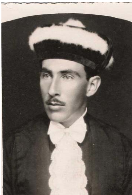
Figura 12: Foto da Formatura de Veterinária, 1943.