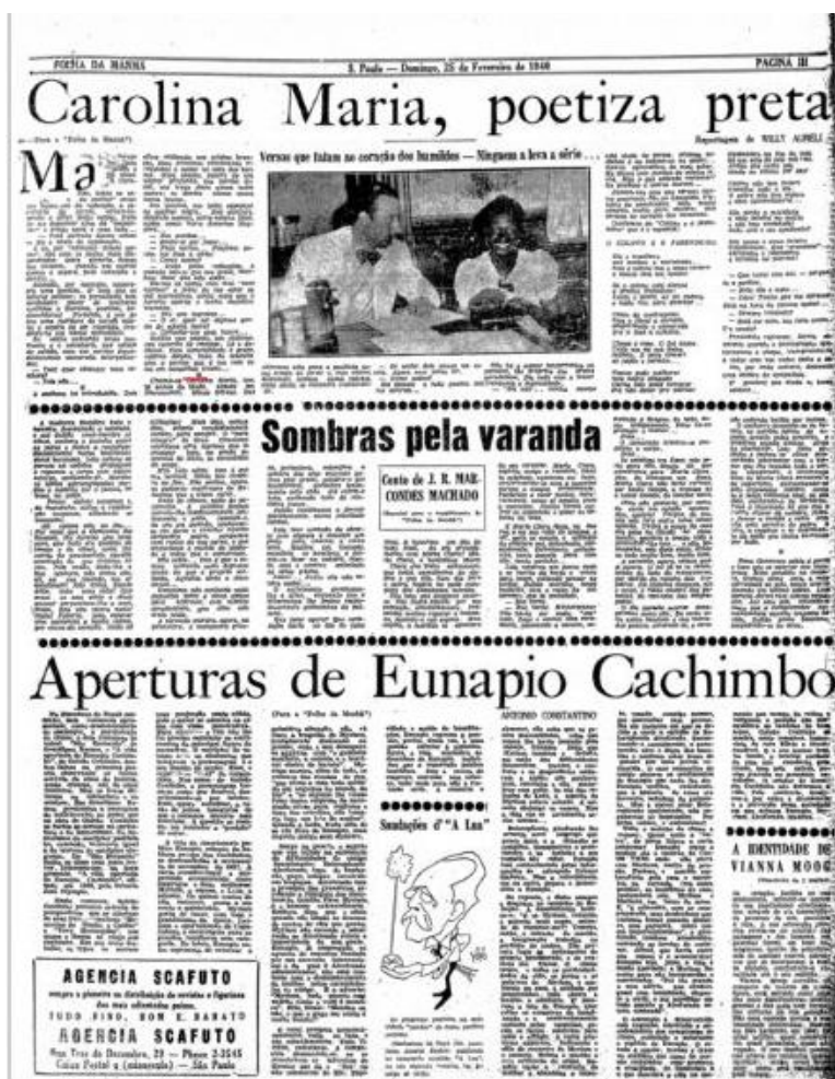
Figura 3 - Reportagem da Folha da Manhã (SP), Domingo, 25 de fevereiro de 1940, Suplemento, p. III.