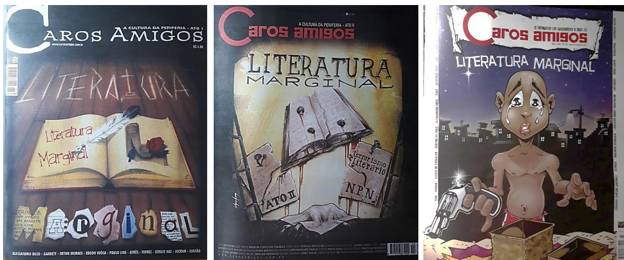
Figura 6 - Revista Revistas Caros Amigos/Literatura Marginal Ato I, II e III, respectivamente.

O trabalho editorial dos três Atos é composto por desenhos de artistas já reconhecidos ou por leitores que querem expor seus trabalhos. Os gêneros dos textos são diversos, em sua maioria, são contos e poemas. No total, os três números reúnem 80 textos de 48 autores. O primeiro número teve tiragem de 30 mil exemplares; o segundo e o terceiro, de 20 mil cada. As revistas foram comercializadas, respectivamente, por R$ 4,90, R$ 5,50 e R$ 7,00.