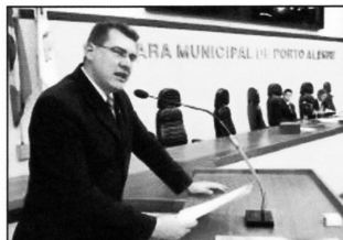
Código: 859 - Tribuna Popular - 24/08/2006 Mutirão de Natal da Igreja Adventista