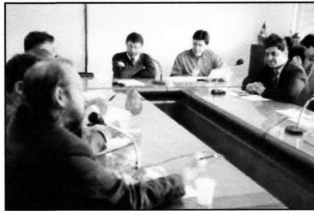
Código: 856 - cedecondh - 24/08/2006 segurança privada Na foto: pf, smdhsu, smic, smov e outros