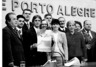
Campanha para recolher alimentos foi apresentada aos vereadores