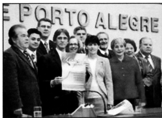
Código: 858 - Tribuna Popular - 24/08/2006 Mutirão de Natal da Igreja Adventista Na foto: Representantes da Instituição Adventista Sulriograndense de Educação e Assistência Social