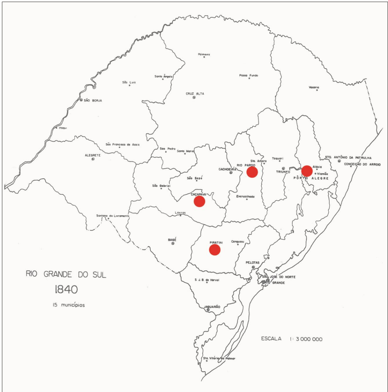
Figura 1 – Mapa do Rio Grande do Sul – 1840.